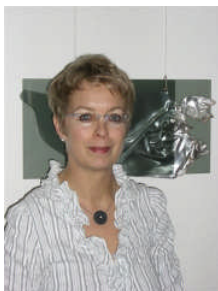
Dipl. Sozialarbeiterin Trauerberaterin Psycho-Onkologin Psycho-Soziale Beraterin

Schon in der Schwangerschaft ist es betroffenen Eltern wichtig und eine große Unterstützung, zu erfahren, wie sie sich auf die zukünftige Zeit vorbereiten können, wo hilfreiche Informationen und Unterstützung zu finden sind. Daneben kann die konstruktive Auseinandersetzung mit der Diagnose/Prognose neue Perspektiven aufzeigen.